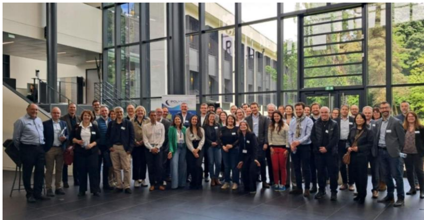
Les adhérents Polymeris lors de l'Assemblée Générale Anniversaire, ici à Charbonnières-les-Bains