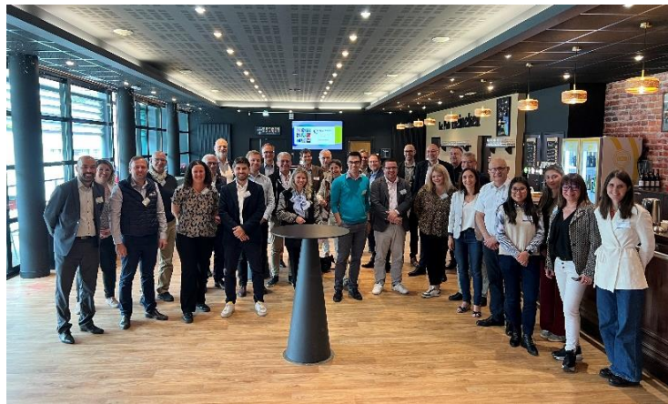
Les adhérents Polymeris lors de l'Assemblée Générale Anniversaire, ici à Oyonnax

C'est en multiplex depuis Oyonnax (01), Charbonnières-les-Bains (69), Orléans (45), Dijon (21), Bordeaux (33), Vitry-sur-Seine (94), que l'Assemblée Générale Anniversaire de Polymeris a rassemblé plus de 200 participants, répartis sur les 6 sites. L'occasion de réaffirmer son rôle clé dans l'accompagnement des projets d'innovation vers une industrie plus verte, numérique et souveraine, tout en consolidant sa position de leader européen dans les matériaux avancés.